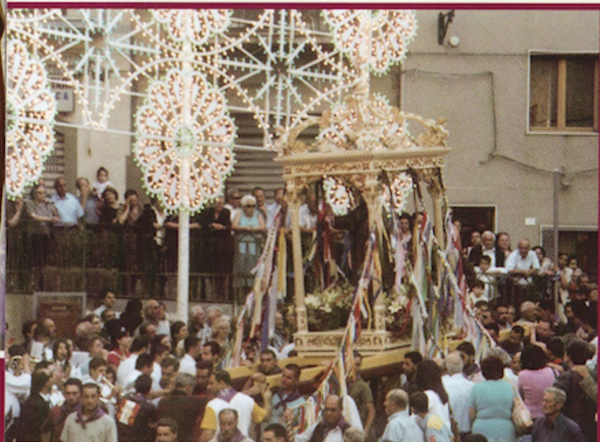
La parte iniziale della processione