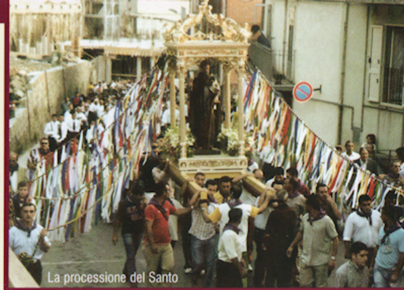
La processione del Santo

glie mortali presso la Chiesa di San Trophime di Arles (Francia). Tale reliquia è stata concessa in Sicilia alla comunità di Aci Sant'Antonio (CT) l'anno scorso in occasione dell'Anno Giubilare Antoniano e grazie alla collaborazione e alla manifestazione di fede che ci hanno contraddistinto in tale occasione la comunità di Aci Sant'Antonio attraverso il parroco Don