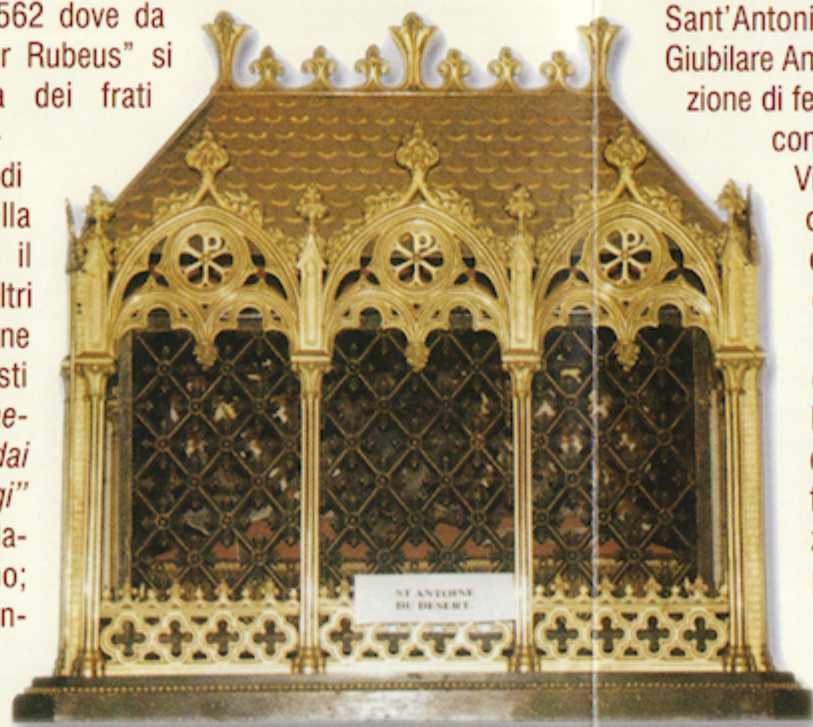
Urna Reliquiaria di Sant'Antonio Abate custodita ad Arles (Francia)